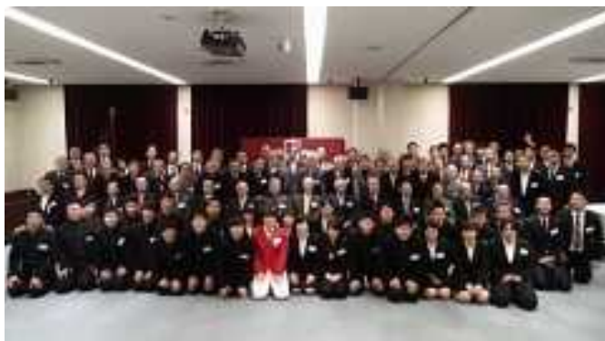
<祝賀会終了後の集合写真>

また、60周年記念誌も同日無事発刊を迎え、出席者の皆さまにお持ち帰りいただきました。祝賀会ならびに記念誌制作にご参加ご協力いただいた皆さまに深謝申し上げます。