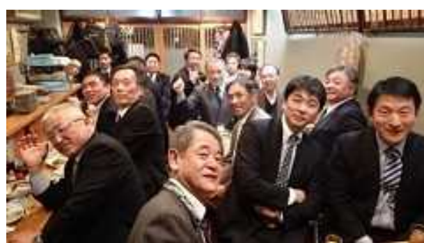
<源兵衛での二次会にも多くの先輩が参加しました>