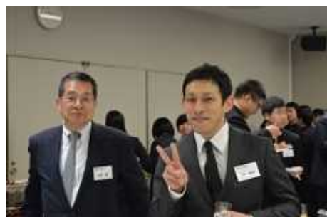
<OB・OG・現役部員が一堂に会し60周年を祝うとともに親睦を深めました>